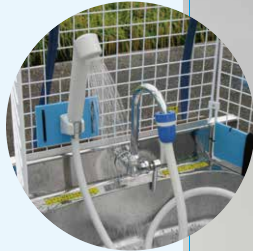
シャワー・手洗い

ポンプで水を高い位置に揚げ、落差での水使用ができるようになった事で（特許出願）手洗のほかシャワーによる洗髪など災害時の感染症対策として役立つ機能が生まれました。