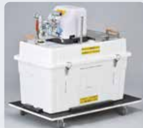
まかないくん水道ポンプ MNK-JP-400S