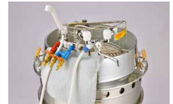
まかないくん30・50・85型共用 ¥210,100 (税抜191,000円)

炊き出し器「まかないくん」に取り付けて湯を取り出す。一番熱い上部から熱を取り出すので高温水が取れる。水の煮沸消毒の効率化にも (足元暖房は裏面に)