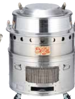
木蓋タイプ/ステンレスタイプ共 85型 ¥534,600 (税抜486,000円) (バーナー含まず)