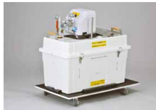
MNK-JP-400S ¥858,000 (税抜780,000円)

水道の主要役割を担う、小さく収納(1/2)・大きく使うシャワー・流し台など多用途。ステンレス・インバーターポンプで省エネ。