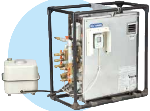
直圧タイプ ¥492,800 (税抜448,000円)