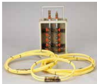
15m ¥45,430 (税抜41,300円)