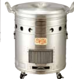
30型 ¥251,900 (税抜229,000円) (バーナー含まず)