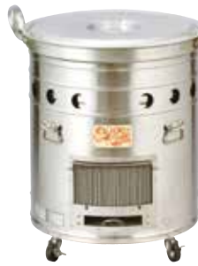
50型 ¥382,800 (税抜348,000円) (バーナー含まず)